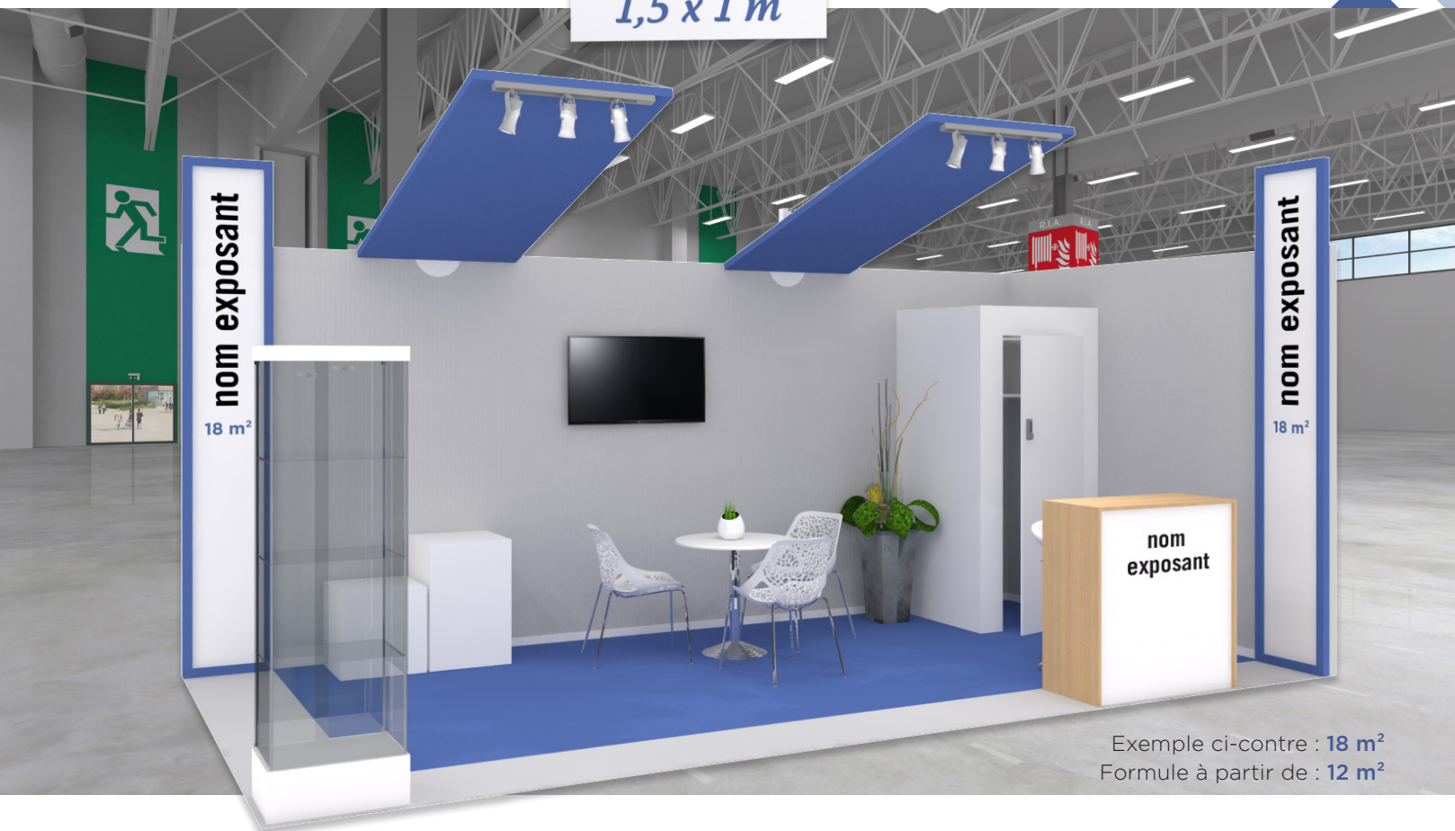
Exemple ci-contre : 18 m 2 Formule à partir de : 12 m 2