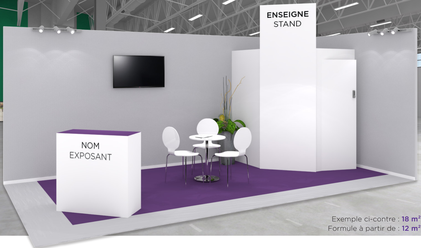
Exemple ci-contre : 18 m 2 Formule à partir de : 12 m 2