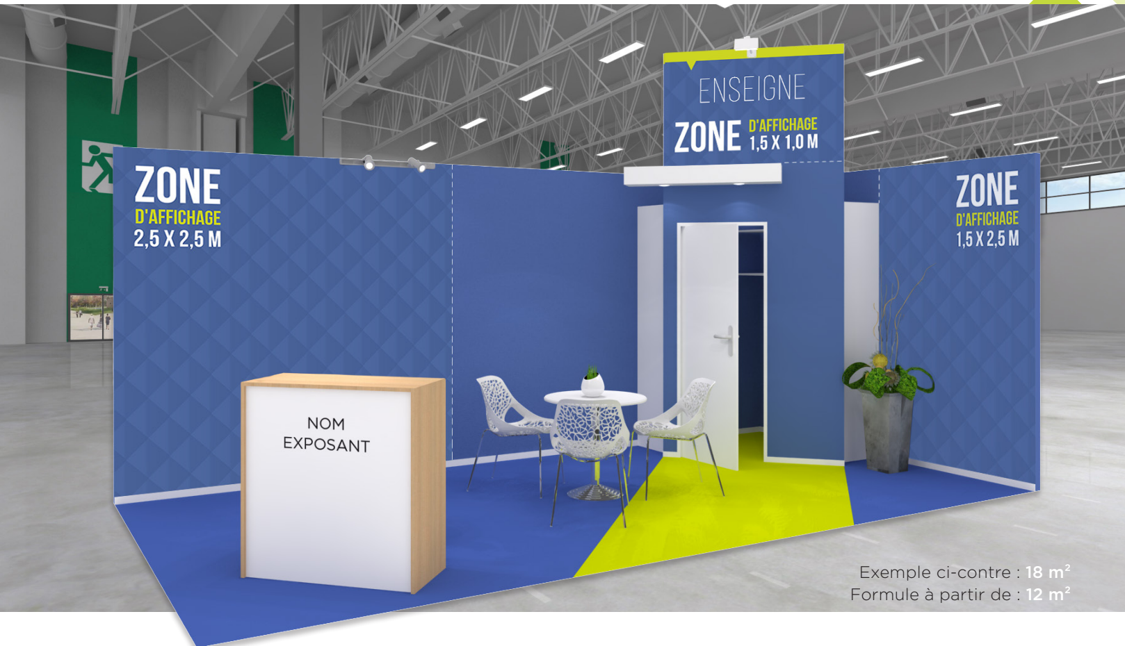
Exemple ci-contre : 18 m 2 Formule à partir de : 12 m 2