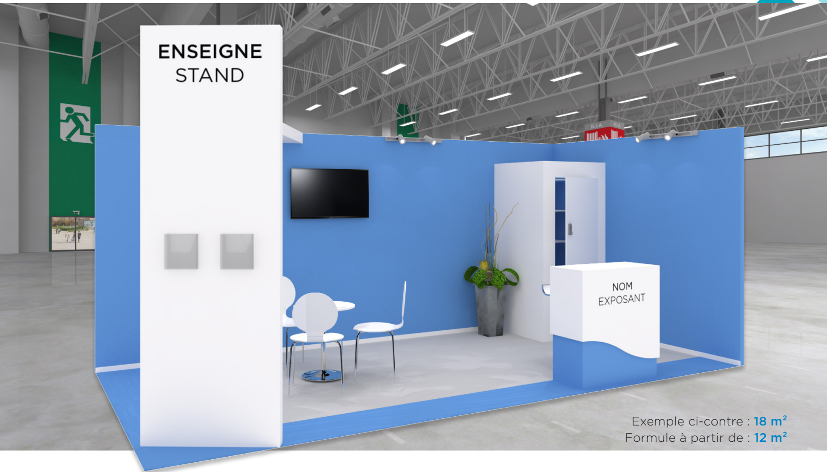
Exemple ci-contre : 18 m 2 Formule à partir de : 12 m 2