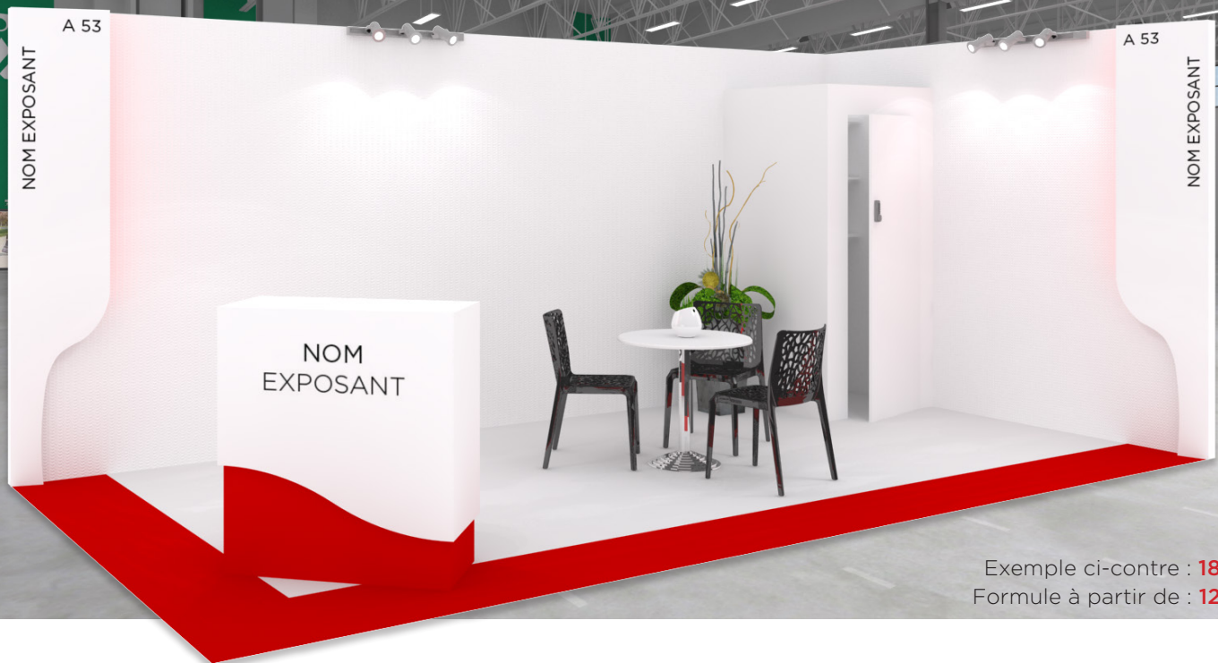
Exemple ci-contre : 18 m 2 Formule à partir de : 12 m 2