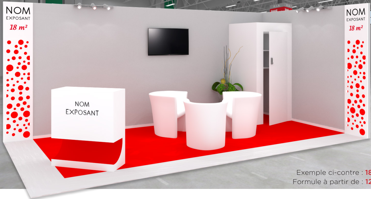
Exemple ci-contre : 18 m 2 Formule à partir de : 12 m 2