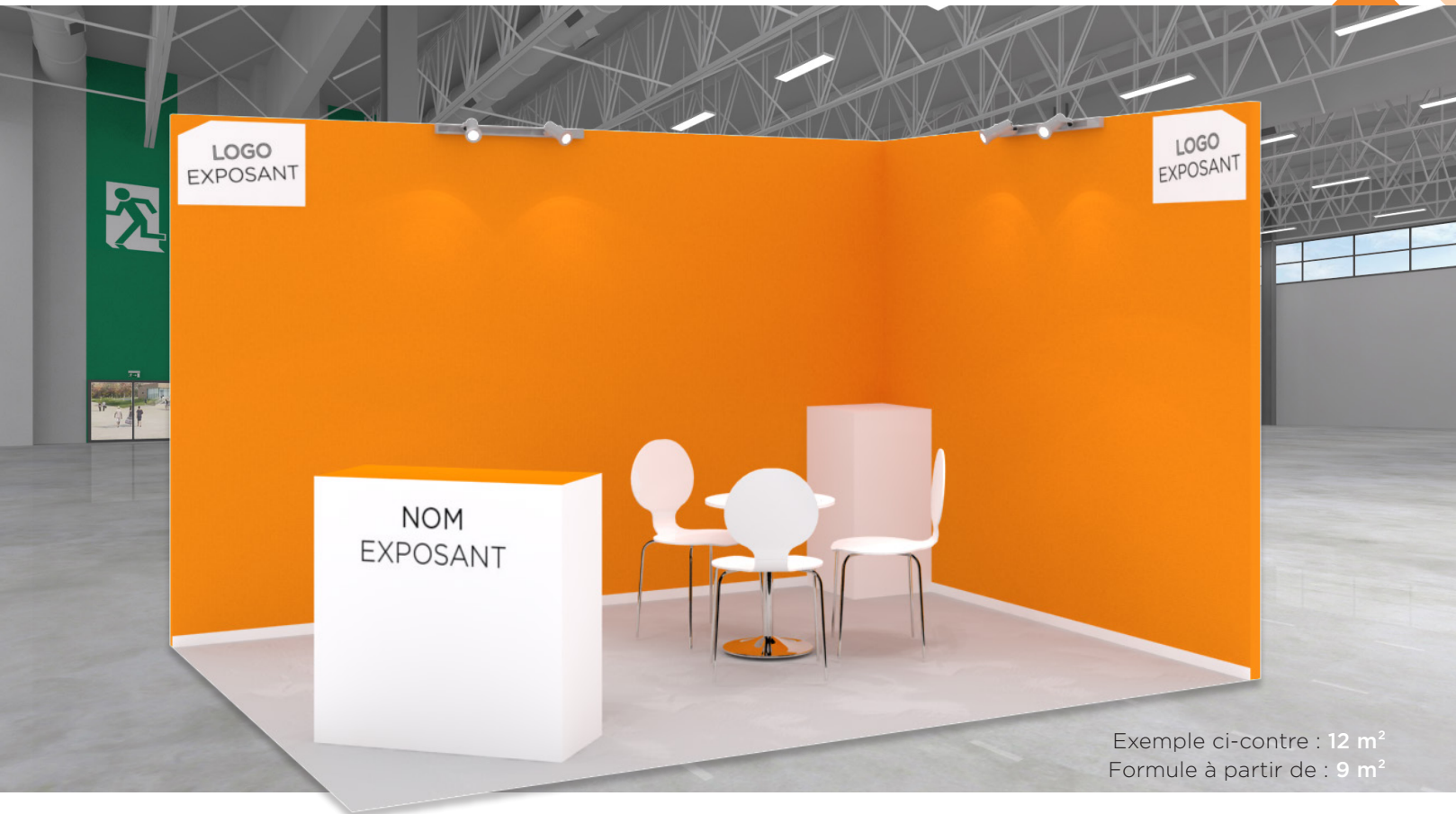
Exemple ci-contre : 12 m 2 Formule à partir de : 9 m 2