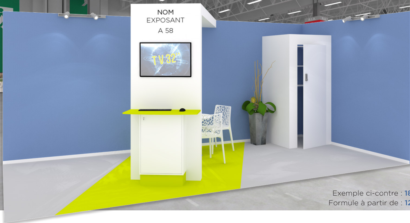
Exemple ci-contre : 18 m 2 Formule à partir de : 12 m 2